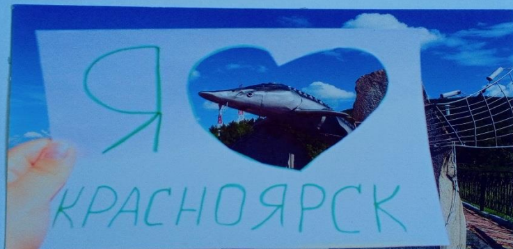
«ЦАРЬ-РЫБА» с. Овсянка