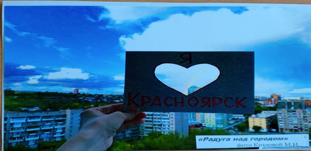
«Радуга над городом»